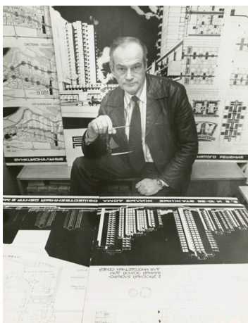
Fig. 2 Mart Port. Foto del 1982.