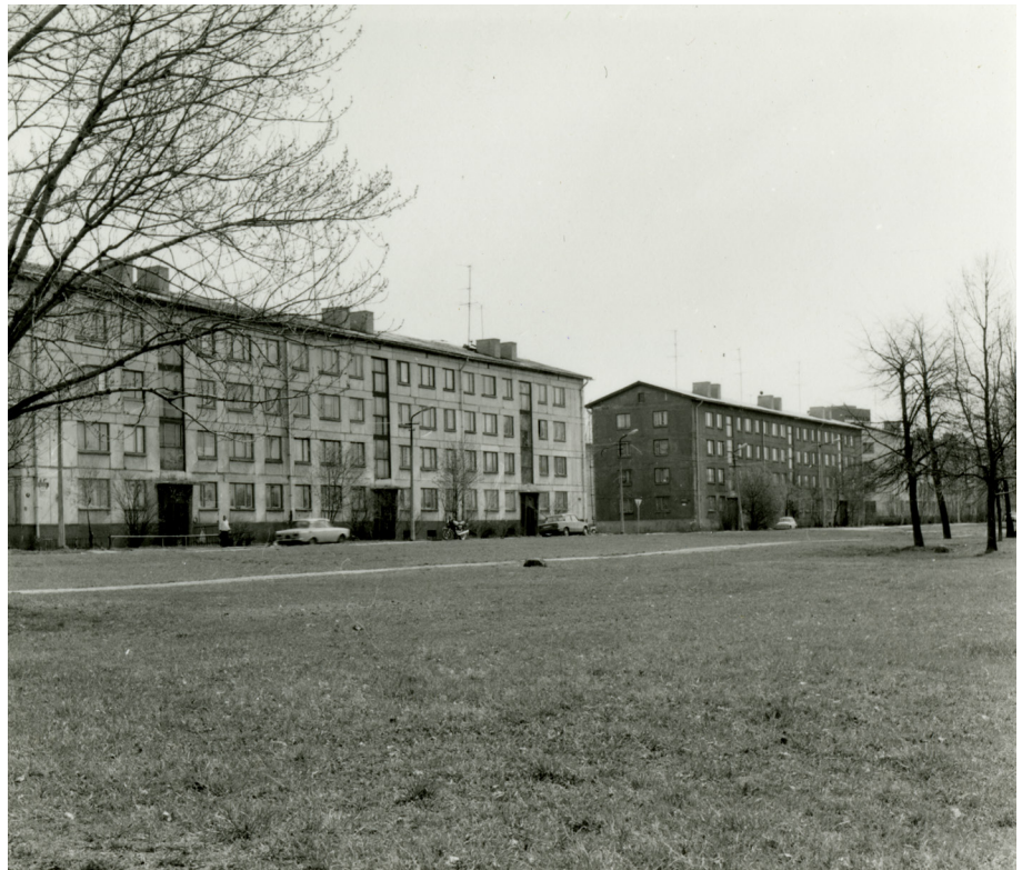
Fig. 4 Mart Port, Roman Urb, Ülo Ellandi. Progetto tipo 1-317, 1957. Foto degli anni Ottanta.

Mosca rappresentava il fulcro del potere accademico e tecnologico e, proprio per questo, era il centro nevralgico della comunicazione internazionale, attirando migliaia di tecnocrati. Port si recava a Mosca anche in occasione di riunioni professionali e congressi di rilievo nazionale e internazionale. Tuttavia, poiché negli archivi personali dell'Associazione degli Architetti non sono stati conservati documenti relativi ai viaggi effettuati all'interno dell'Unione Sovietica, non è possibile determinare con esattezza quante volte ciò sia avvenuto.