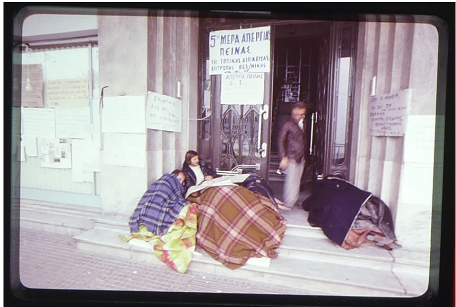
Fig. 3 Diapositiva del Mart Port dalla Grecia, anni settanta.

Port fu coautore di 214 progetti architettonici, la maggior realizzati. Quasi per la metà si trattava di progetti “tipo” ripetuti in luoghi diversi. Come membro di un collettivo, Port progettò alcuni importanti grattacieli di Tallinn: la sede del Partito Comunista (ora Ministero degli Affari Esteri), l’Hotel Viru e la Casa dei Progettisti (Ojari 2012). Il fatto che un solo uomo abbia orientato per quasi quarant’anni la produzione architettonica e la pianificazione urbana – oltre ad essere stato presidente dell’Associazione degli Architetti per 25 anni – dimostra quanto fosse personalista e rigido l’apparato di potere dell’epoca. Il fatto che Port non fosse membro del Partito Comunista era l’eccezione che confermava la regola: lo Stato sovietico non era governato dalla legge, ma dagli uomini (Lewin 2005). Pochi mesi dopo il crollo dell’Unione Sovietica, l’architetto e artista Leonhard Lapin pubblicò un articolo in cui riassumeva senza mezzi termini gli anni Settanta nell’architettura estone come una contrapposizione tra i giovani e Mart Port: «La vita architettonica ufficiale dell’Estonia sovietica era governata in modo dittatoriale dal mellifluo Mart Port, che, sia con le sue parole che con le sue vignette, creava splendide visioni del trionfo del comunismo in città ideali del futuro, popolate da persone e automobili che sfrecciavano» (Trapeež 1991).