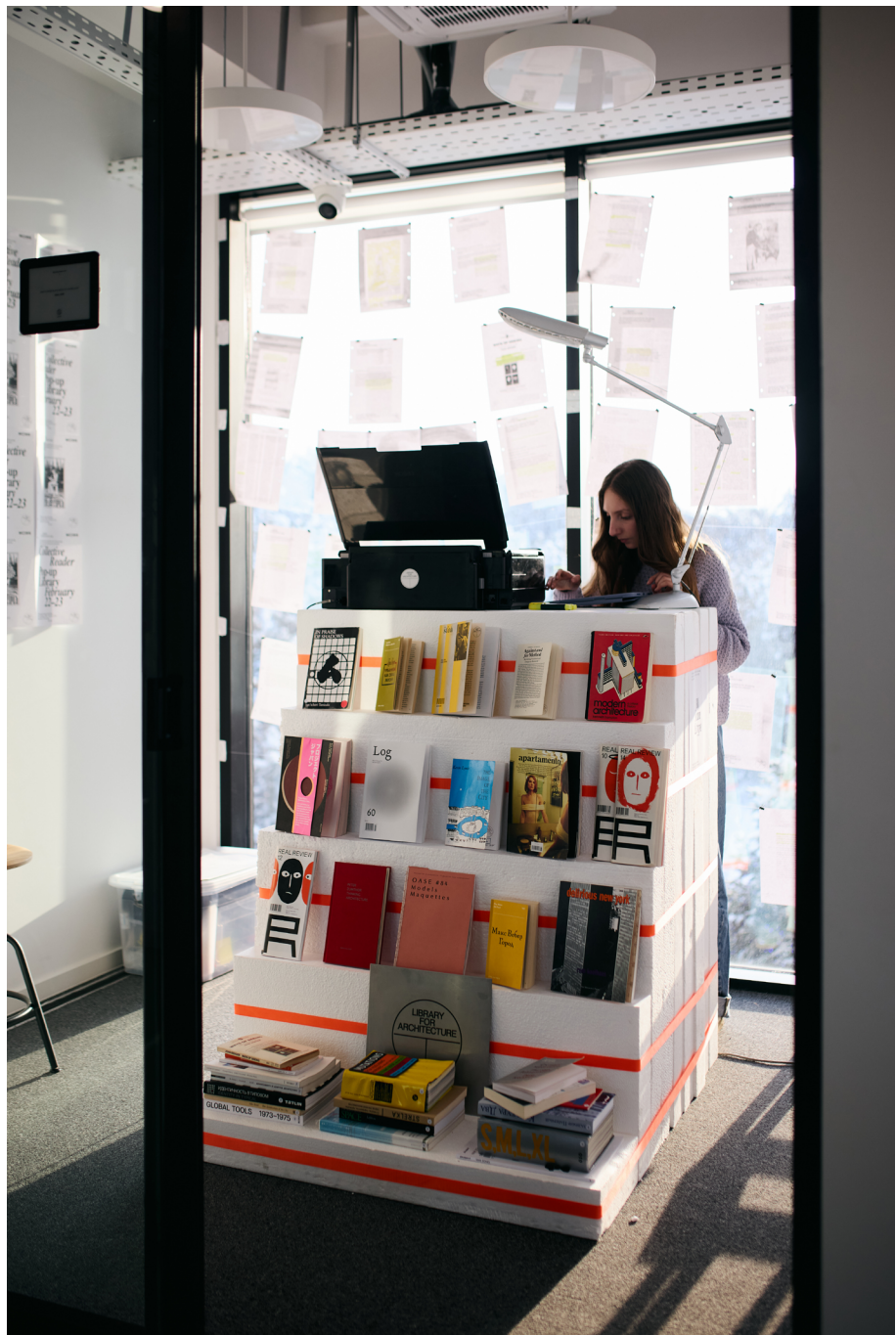
Fig. 6 LFA, "Collective reader", scattata durante il BOOKUBORAN LitFest, Woods Center, 2025.

discussioni e una comunità in crescita. Qualcosa che integri il sistema esistente offrendo un altro modo di apprendere.