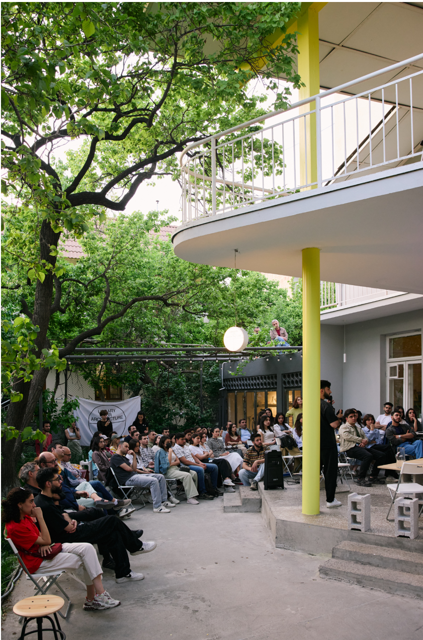
Fig. 3 Public talk "Method", foto di Mitya Lyalin.