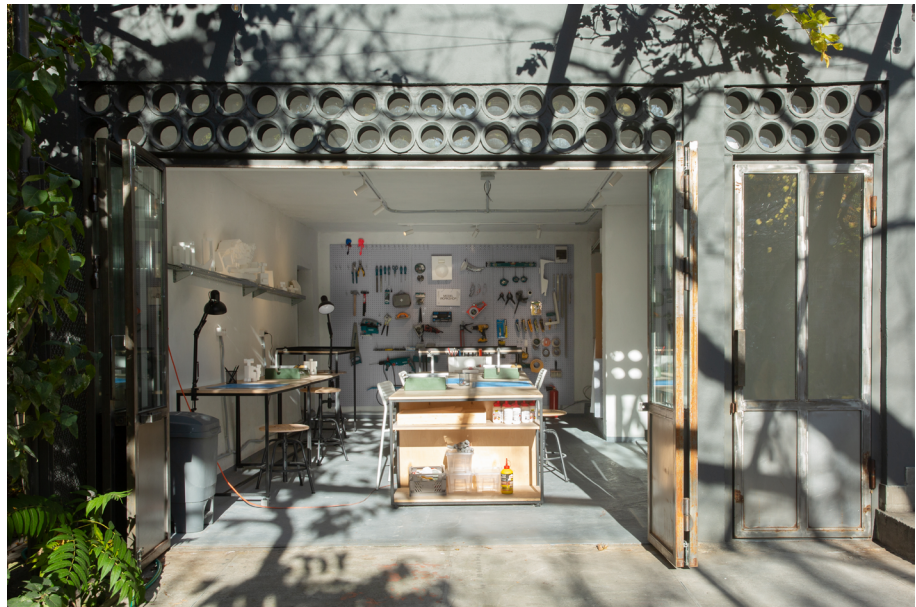
Fig. 2 Garage Modeling Workshop, foto di Anna Prilutskaya.

La Library for Architecture (LFA) si trova in un cortile nel centro di Yerevan, nell'ex casa degli architetti Freidun e Armen Aghalyan. Il piano terra è aperto al pubblico: comprende una sala biblioteca con oltre 460 libri, dove si svolgono incontri e discussioni di vario tipo (Fig. 1), e una cucina con tutte le dotazioni essenziali. Sullo stesso livello si trova il laboratorio di modellistica nel garage (Fig. 2), aperto a studenti e professionisti che vogliono costruire modelli e apprendere attraverso sessioni introduttive quindicinali. Anche il giardino ospita diverse attività, dai workshop con studenti alle discussioni all'aperto quando il clima lo consente (Fig. 3, Fig. 4).