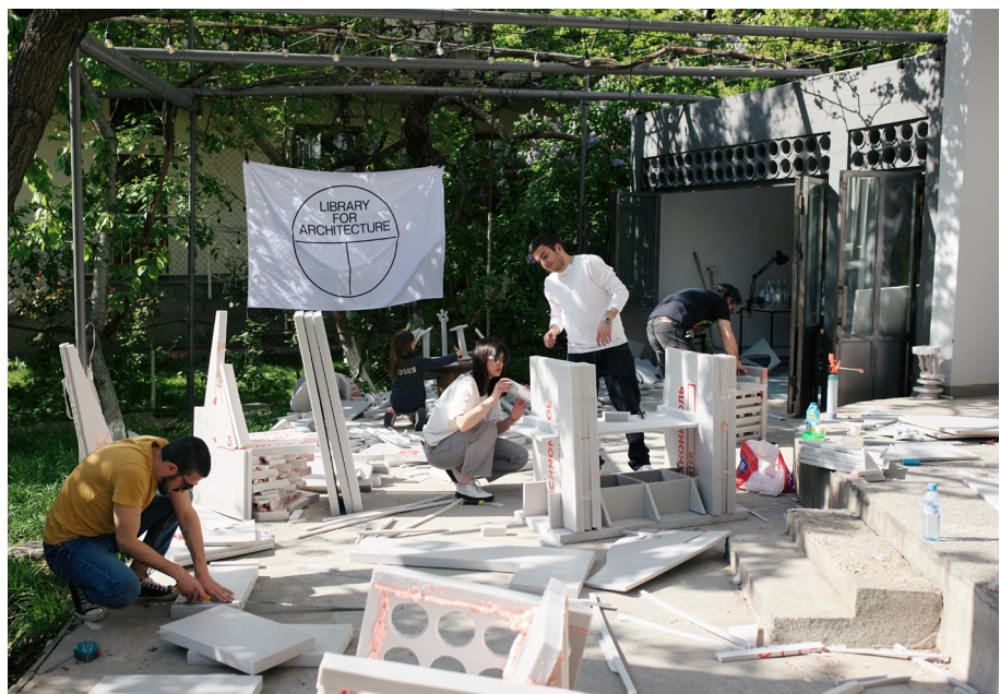
Fig. 4 1:1 Workshop, LFA, foto di Mitya Lyalin.