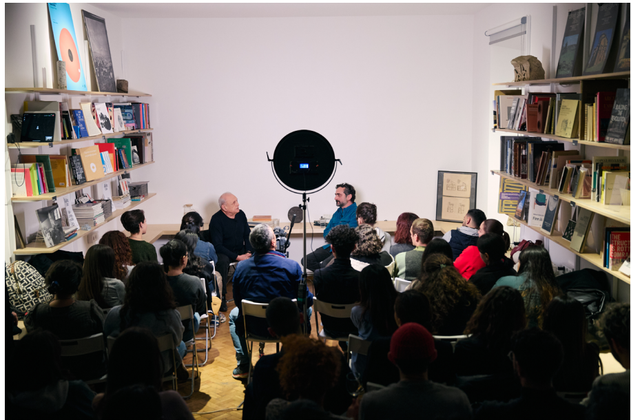
Fig. 1 Intervista, "programma 12 mesi", LFA.