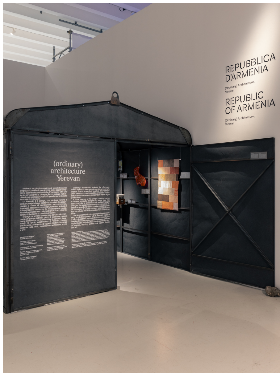
Fig. 8 National Pavilion of Armenia, Triennale di Milano, Curatorial team: LFA, Meganom, e untitled architecture. Foto di Giovanni Galanello, 2025

noi, questo stesso processo è diventato un momento educativo: partecipare a una riflessione condivisa su temi reali e attuali, contribuendo a una comprensione collettiva della città (Fig. 8).