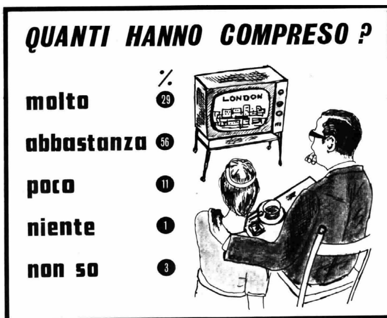
Fig. 5 Illustrazione riferita al sondaggio condotto sui telespettatori dell'inchiesta "Londra. Problemi di una metropoli", 1967 (da Radiocorriere 45 1974)

dell'esperienza spaziale, Zevi privilegia in un primo momento – come tutta la sua generazione – la radio, per la connaturata dimensione di approfondimento culturale connessa ad un pubblico più maturo (Architettura e urbanistica 1956, L'architettura di Biagio Rossetti 1960). Era fatale però che da provocatore colto e al contempo pop venisse fagocitato nell'universo televisivo. Una delle prime e più clamorose uscite in video di Zevi coincide con la scialba mostra sul Bauhaus alla Galleria nazionale, dove il critico liquida il metodo di insegnamento praticato nella scuola tedesca come inattuale e “formalista” (Arti e scienze 1961). L'intervista romana a Gropius verrà assegnata ad altro, più malleabile, conduttore RAI 8 .