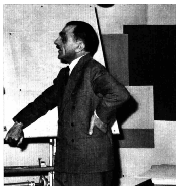
Fig. 2 Carlo Mollino, programma “Dalla palafitta al grattacielo” (Radio-corriere 19, 1958).