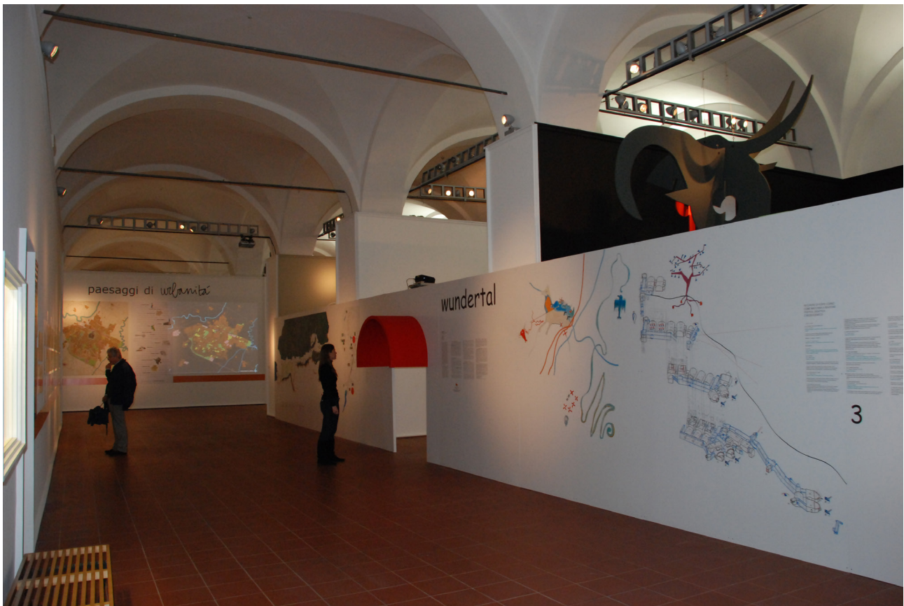
Fig. 10 Immagini scattate in occasione dei Festival dell'Architettura di Parma, 2004-2014.

tante, anche per il resto del mondo?) e i relativi esiti, ci fanno pensare ad una precisa volontà di non scegliere, di non tematizzare, di lasciare tutto nella mistica del flusso del mutare, di non porre chiavi interpretative e di conoscenza dei problemi concreti che l'architettura ha di fronte, nascosti dal vociare sfavillante di una rappresentanza internazionale che, senza un tema dato a cui dare interpretazione, si riduce a rappresentare l'ennesima Torre di Babele.