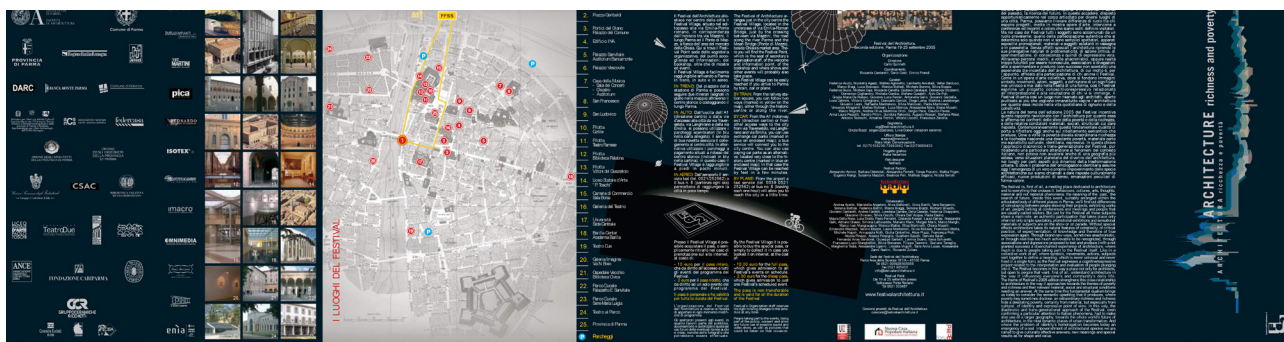
Fig. 2 Brochure del Festival dell'Architettura di Parma, n. 2, 2005.