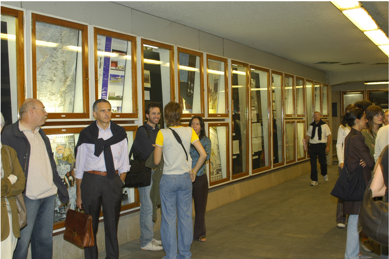
Fig. 12 Immagini scattate in occasione dei Festival dell'Architettura di Parma, 2004-2014.

versitaria, nella fattispecie del dottorato e dell'alta formazione attraverso il convegno POSTDOT/Composizioni, che, nelle intenzioni, dovrebbe poter aprire alcune finestre sul futuro della ricerca, sui problemi di indirizzo tematico, sui rapporti tra filoni disciplinari differenti e soprattutto sulla possibilità di confrontarne i relativi approcci metodologici.