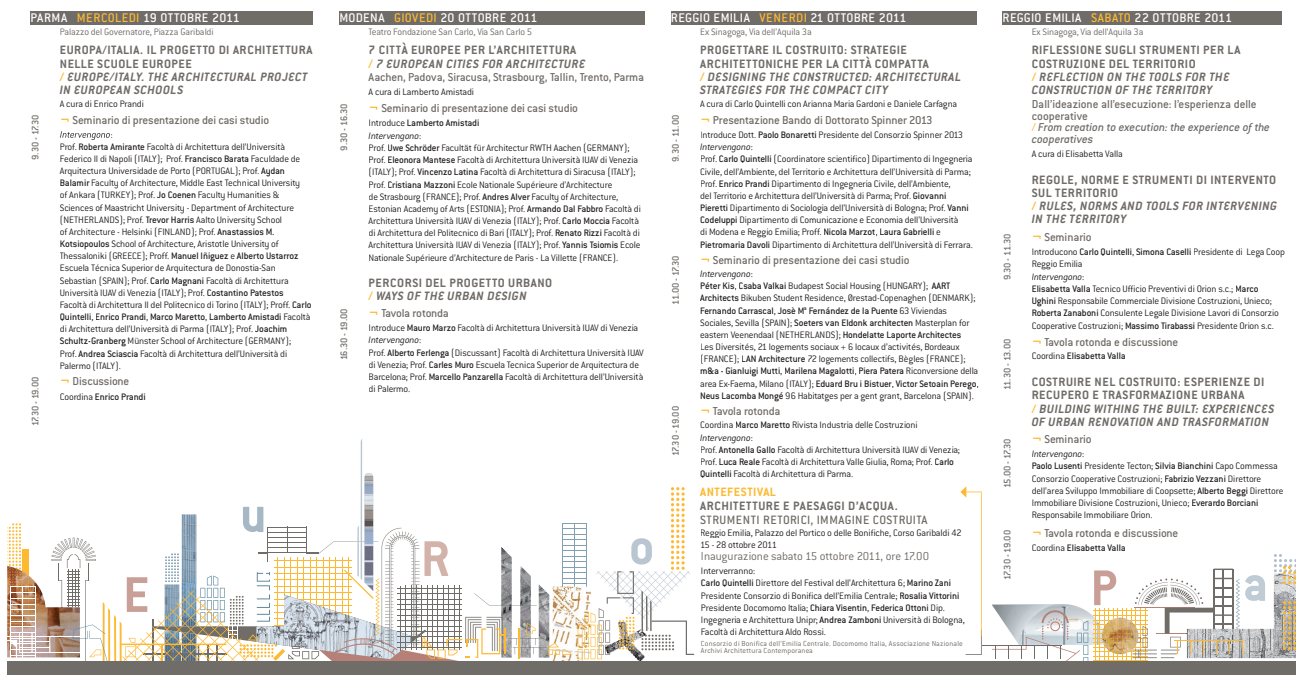
Fig. 6 Brochure del Festival dell'Architettura di Parma, n. 6, 2011.