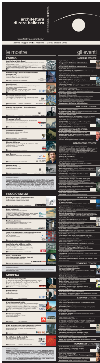
Fig. 3 Brochure del Festival dell'Architettura di Parma, n. 3, 2006.