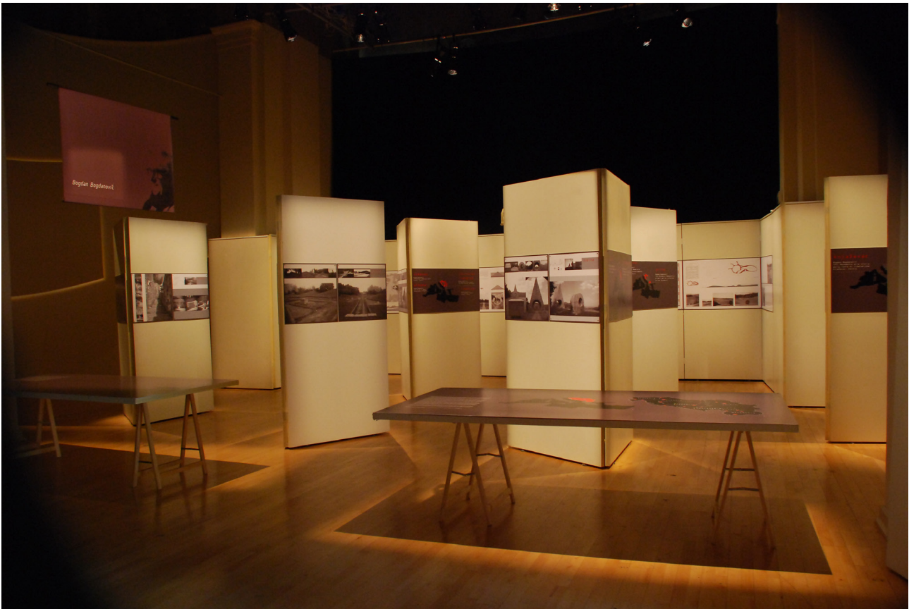
Fig. 14 Immagini scattate in occasione dei Festival dell'Architettura di Parma, 2004-2014.