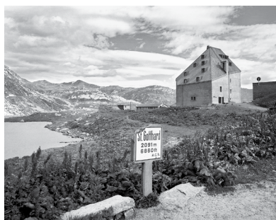
Miller & Maranta, progetto per il Vostro Ospizio del San Gottardo, 2005-2008, Anzio