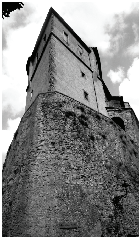
Castello Orsini a San Vito / Orsini Castle in San Vito

centri minori, il loro formarsi con caratteri tipici, le potenziali trasformazioni e “annodamenti” in luoghi nodali della città a formare anche nuovi organismi edilizi specializzati che innovano l’edilizia esistente in modo conforme e proporzionato permettendo di evitare uno sprawl specialistico (si veda il caso dello spostamento dei municipi al di fuori del centro) che si aggiunge, con esiti disastrosi, a quello abitativo.