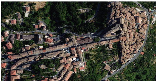
Foto aerea del centro storico di San Vito / Aerial view of historical centre of San Vito

Design methods for minor centers of Lazio