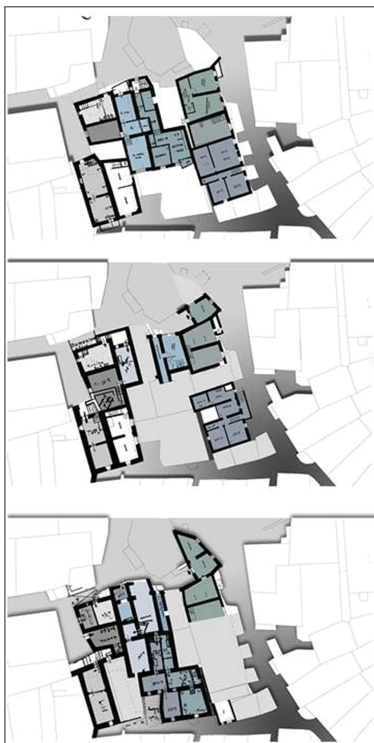
Pianta degli edifici dell'area degradata. Lettura degli avanzamenti su strada e studio dei percorsi / Buildings plan of the degraded area. Reading of the advancements on the road and study of the routes