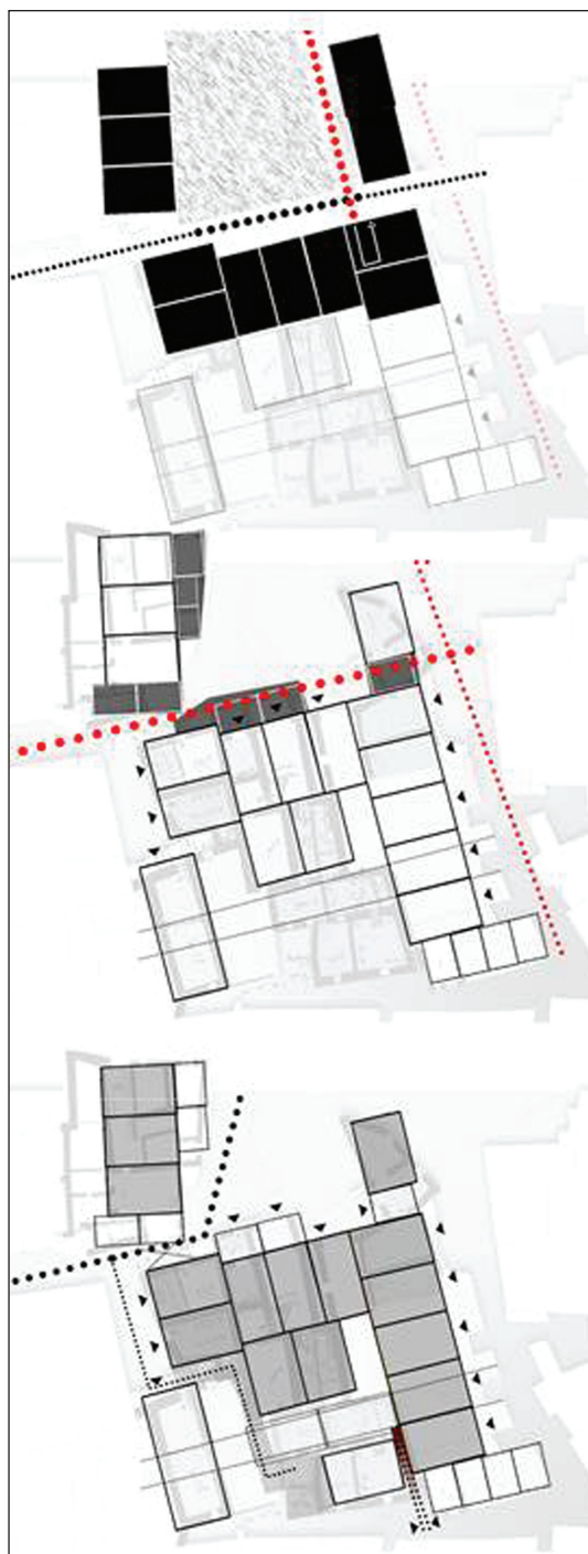
Pianta degli edifici dell'area degradata. Lettura degli avanzamenti su strada e studio dei percorsi / Buildings plan of the degraded area. Reading of the advancements on the road and study of the routes