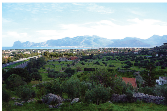
Villagrazia di Carini / Villagrazia di Carini