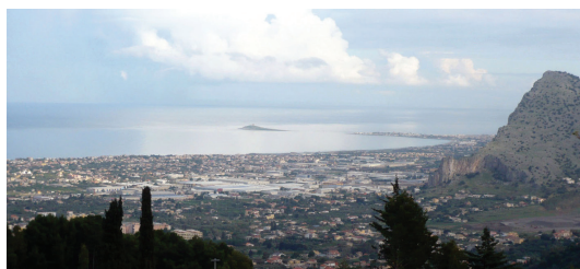
Capaci e Isola delle Femmine / Capaci and Isola delle Femmine

ad alcuni centri abitati come: Isola delle Femmine, Capaci, Carini, Cinisi e Terrasini. La doppia polarità costituita da Palermo e dall'aeroporto agisce oggi su quelle aree agricole, per la verità sempre più sparse, e su quegli spazi, genericamente "verdi" che costituiscono una sorta di liquido amniotico residuale, compreso fra i luoghi urbani più densi sopra menzionati. Approfondire la natura di questo liquido implica indagare le parti più viscosi costituite da piccoli gruppi edilizi, da alcune piantumazioni arboree e dalle colture agricole. I nuclei, più "duri" o più "morbidi", sembrano galleggiare, all'interno del liquido, in insiemi dispersi. Prendere atto della loro consistenza coincide con lo studio delle trasformazioni in atto, di quel che resta della campagna. Lo sguardo che indaga potrebbe limitarsi a riconoscere nel fluido, oggetto dello studio, le caratteristiche della città dispersa o, se si preferisce, della campagna urbanizzata senza spingersi oltre. In realtà il fenomeno è più complesso e, nel disordine dei frantumi, si distingue la perdita dell'azione attrattiva dei centri abitati, il venire meno della redditività delle colture agricole e un prevalere delle infrastrutture stradali nel disegno delle espansioni urbane. Osservare questi elementi che