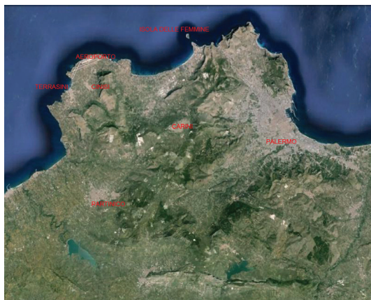
Area di studio. Ortofoto / Area of study. Orthophoto