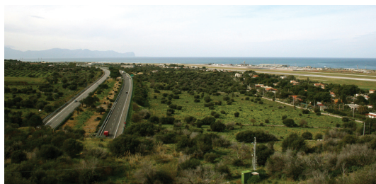
L'autostrada A29 e l'aeroporto Falcone Borsellino / A29 highway and Falcone Borsellino airport