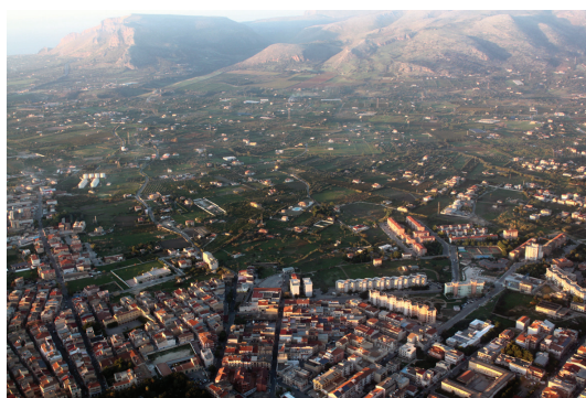
Partinico nord est, sullo sfondo monte Palmeto / Partinico northeast, in the background Mount Palmeto