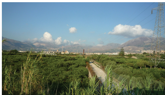
Distilleria Bertolino, Partinico / Bertolino Distillery, Partinico

rispettivamente: due a Carini, una a Cinisi, in prossimità dell'aeroporto, e due a Partinico. I progetti, in alcuni casi puntuali, mettono in discussione complessivamente centinaia di ettari, la maggior parte dei quali sono come invisibili nella quotidiana esperienza dell'abitare. Impercettibili perché nascosti dietro recinti generati da abitazioni, da infrastrutture stradali, da impianti industriali che celano, tanto alla città, quanto alla campagna, potenzialità che oggi è possibile osservare solo da prospettive a volo d'uccello.