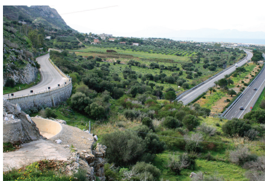
La strada statale 113 e l'autostrada A29, nei pressi dell'aeroporto Falcone Borsellino / 113 state road and A29 highway, near Falcone Borsellino airport