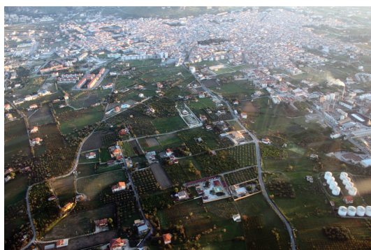
Partinico / Partinico