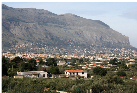
Carini e Monte Pecoraro / Carini and Mount Pecoraro